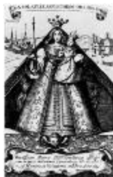
Maria, Mutter Gottes in Kevelaer: Trösterin der Betrübten – Consolatrix Afflictorum

Die Gründe sind so zahlreich und verschieden, wie es Menschen gibt, die hierher (nach Kevelaer) kommen aus Freude und Dankbarkeit, mit tiefem Glauben oder aus seelischer Not, in Zweifel und Sorge. Der Letzteren wegen geschehen heute immer noch die eigentlichen Wunder in Kevelaer, in der Beichtkapelle, in dem dort nämlich über die Trümmer eines Lebens das Fundament zu einem Neuanfang gelegt wird in der Tiefe des Herzens. Eigenartig, die Anziehungskraft dieses Ortes strahlt ein kleines, unscheinbares Bild aus, das uns an die Jungfrau und Gottesmutter Maria erinnert, die hier unter einer alten Anrufung der Christenheit verehrt wird als Consolatrix Afflictorum, als Trösterin der Betrübten ... Das Gehen zur Trösterin der Betrübten meint jedoch ... nicht das Trostsuchen in einer Traurigkeit, wenn jemand trauert zum Beispiel, weil er den Zug verpasst hat oder